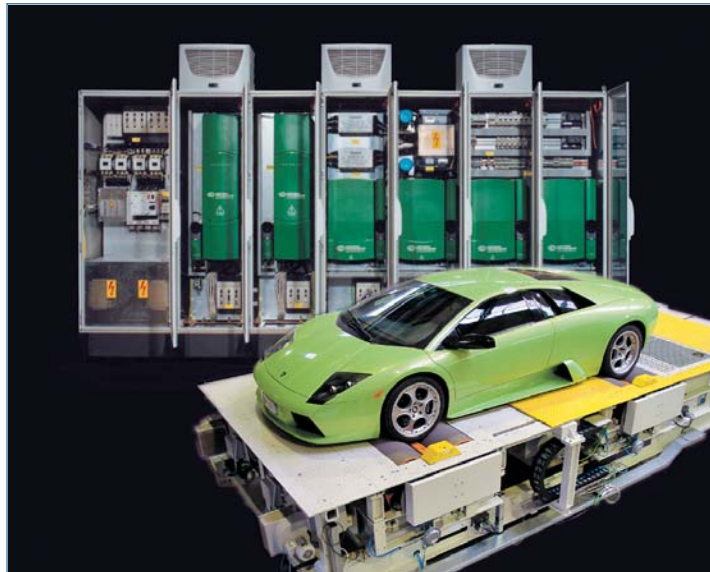
Control Techniques sorgt für kontrollierten Antrieb, überall.

Und angesichts der Fülle der durchgeführten Modernisierungsarbeiten überzeugt den Operations-Manager zudem auch der ausgeprägte Sinn für Wirtschaftlichkeit seines Dienstleisters: „KUTTIG